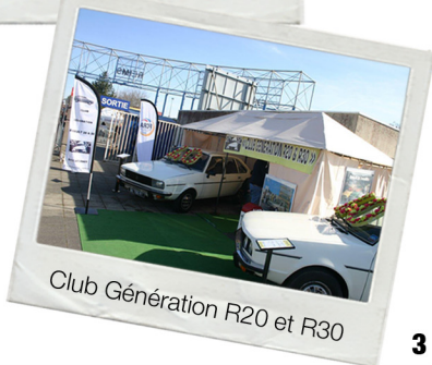
Club Génération R20 et R30