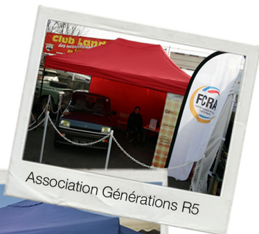
Association Générations R5