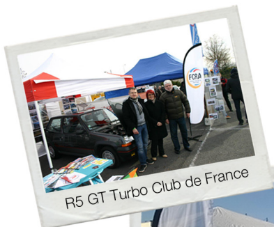
R5 GT Turbo Club de France